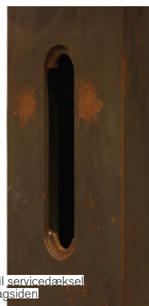
Hul til servicedæksel på bagsiden